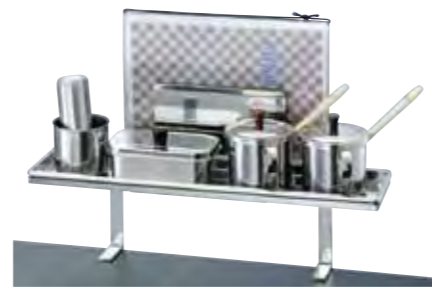
メニュースタンド (付属品は別売) ¥10,000