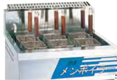
※写真はオプション装着時です。